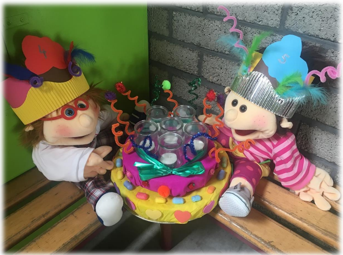
Onze klaspoppen: Louis & Mieke