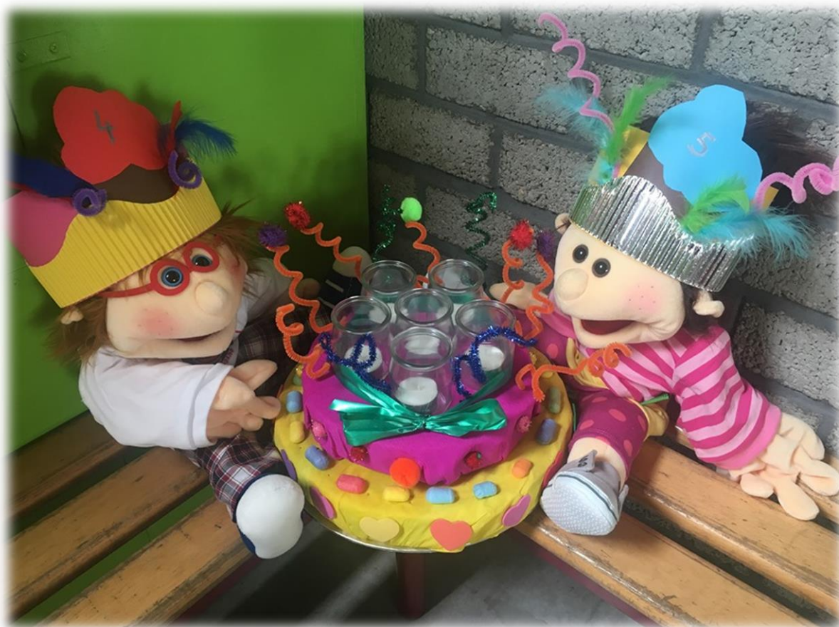
Onze klaspoppen: Louis & Mieke